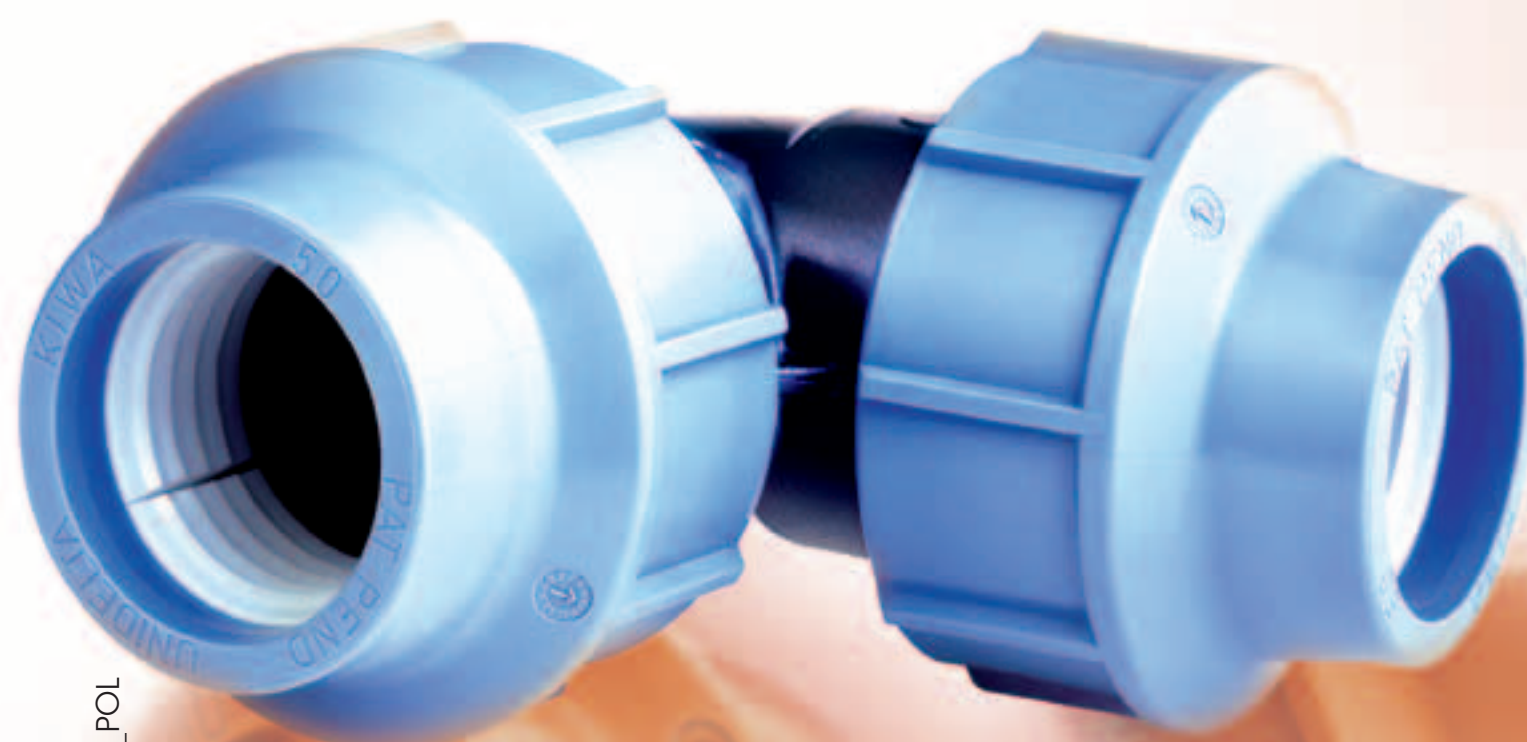
QUICK REFERENCE QR1002_R5_ING_TED_POL